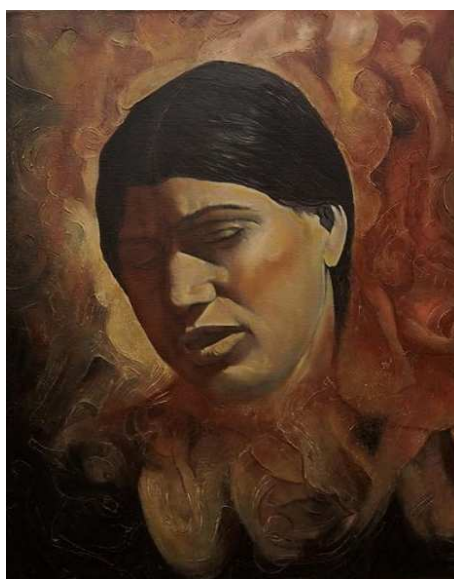
تابلوی شهید فرخنده از استاد ایوبی که در تالار کنفرانس گذاشته شده بود نمادی از تاثیر عوامل دهشت و بنیادگرایی را به نمایش می گذاشت