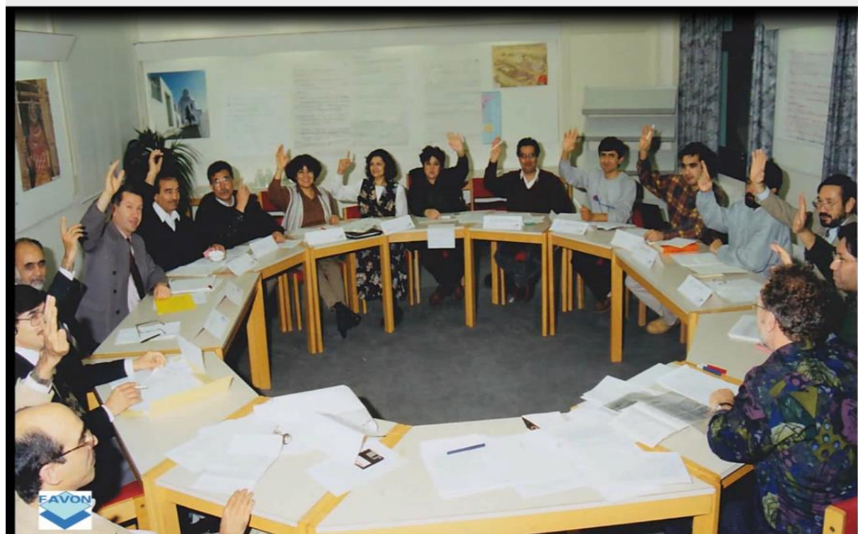
عکسی از جریان کنگره مؤسس فافون در نوامبر 1996 در شهر سوستر برخ هالند. نمایندگان انجمن‌های عضو